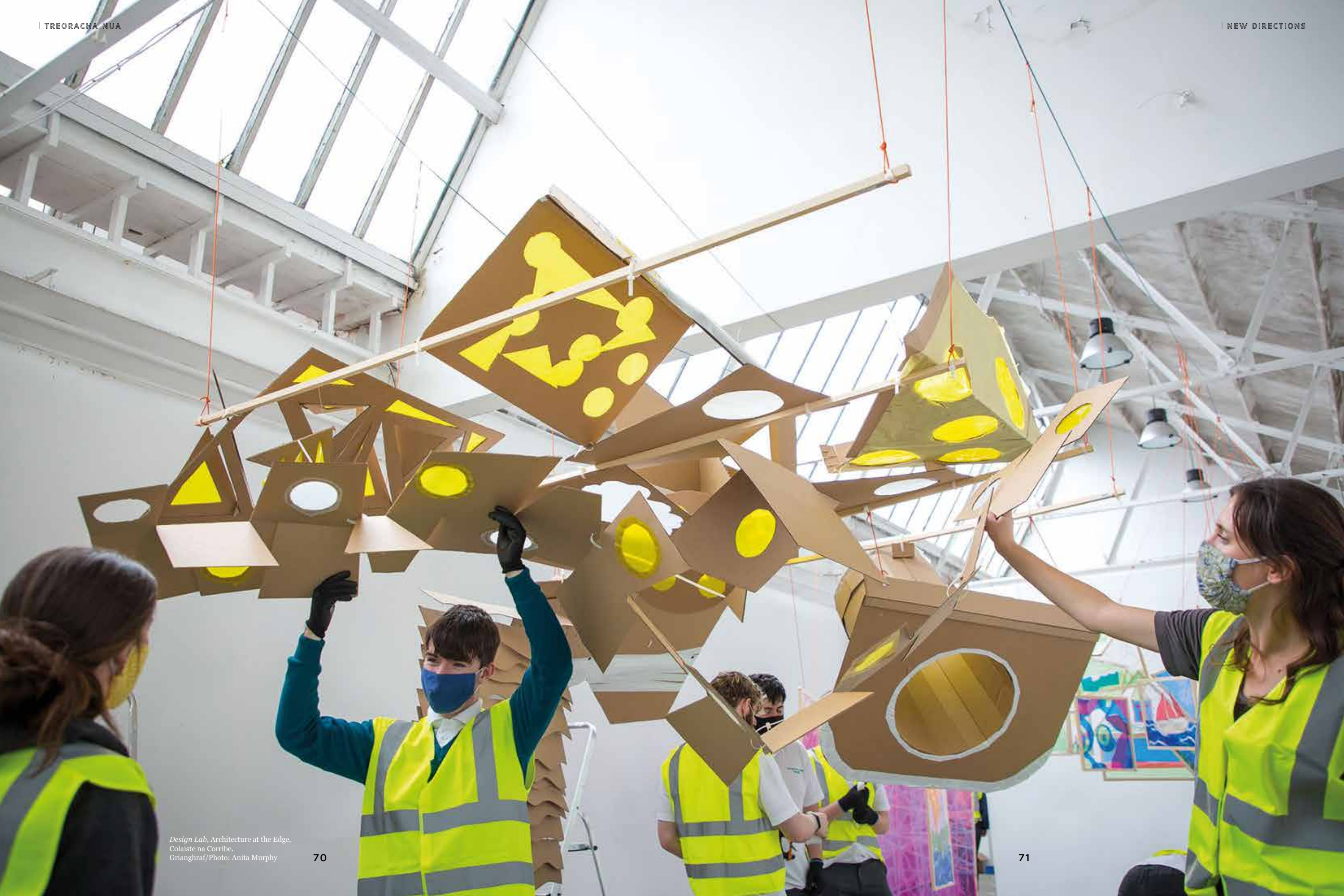
Design Lab, Architecture at the Edge, Colaiste na Corribe.